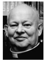
Der Skandal von St. Pölten